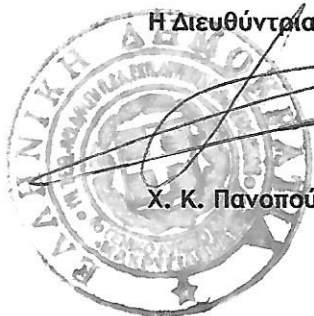
Χ. Κ. Πανοπούλου