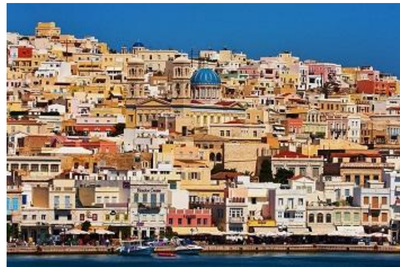
Εικόνα 6. Άποψη της Ερμούπολης.

Η Σύρος συνδέεται ακτοπλοϊκά με τον Πειραιά σε καθημερινή βάση (χρόνος ταξιδιού 3:00-4:30 ώρες), με το Λαύριο, τη Σάμο και τη Ρόδο όπου εδρεύουν άλλα τμήματα του Πανεπιστημίου Αιγαίου, καθώς και με άλλα νησιά των Κυκλάδων. Για να δείτε την κίνηση των πλοίων σε πραγματικό χρόνο συνδεθείτε στο http://www.marinetraffic.com , μια εφαρμογή που σχεδιάστηκε και αναπτύχθηκε από προσωπικό του τμήματος.