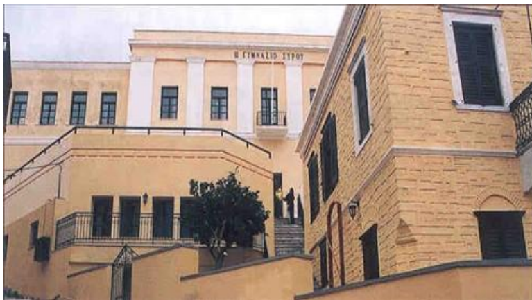
Εικόνα 1. Άποψη του ιστορικού Α' Γυμνασίου Ερμούπολης, όπου στεγάζεται το Τμήμα Μηχανικών Σχεδίασης Προϊόντων και Συστημάτων του Πανεπιστημίου Αιγαίου.

Δίπλωμα: Μηχανικού Σχεδίασης (Design Engineer).