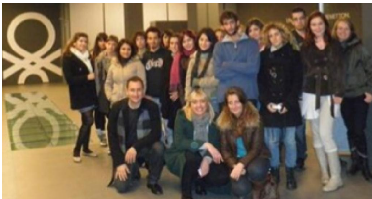
Εικόνα 3. Φωτογραφία από την εκπαιδευτική επίσκεψη των φοιτητών του ΤΜΣΠΣ στην Ιταλία (Μιλάνο, γραφεία εταιρίας Benetton, 2010).

Το τμήμα υποστηρίζει και διαρκώς αναζητά τη συνεργασία με άλλα τμήματα Σχεδίασης του εξωτερικού και μέσω του προγράμματος ανταλλαγής φοιτητών Erasmus. Οι σπουδές στο εξωτερικό μπορούν να αποτελέσουν ιδιαίτερα πολύτιμη εμπειρία επειδή δεν αποτελούν μόνο τον καλύτερο τρόπο να έλθει κανείς σε επαφή με άλλες χώρες, ιδέες, πολιτισμούς, αλλά συνεχώς αναδεικνύονται σε σημαντικό στοιχείο για την εξέλιξη της ακαδημαϊκής και επαγγελματικής σταδιοδρομίας.